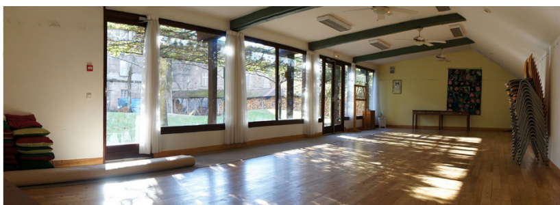
Salle de pratique/conférences